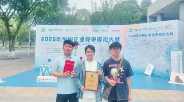
我校经济与管理学院“清溪映月”团队